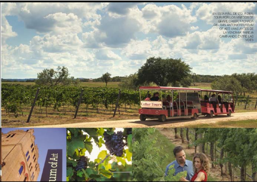
EN ESTA PÁG. DE IZO, ADERI, TOUR POR LOS VINEDOS DE GRAPES CREEK; FICHAJADA DE SAN ANTONIO MUSEUM OF ART; UVAS ANTES DE LA VENDIMIA; RAPEJA CAMINANDO ENTRE LAS VIDES